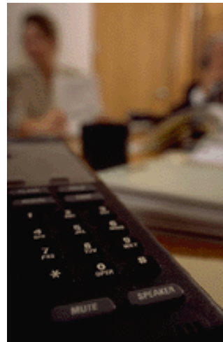
Voor informatie kunt u bellen met:

finance, treasury, tax beheersing werkkapitaal,